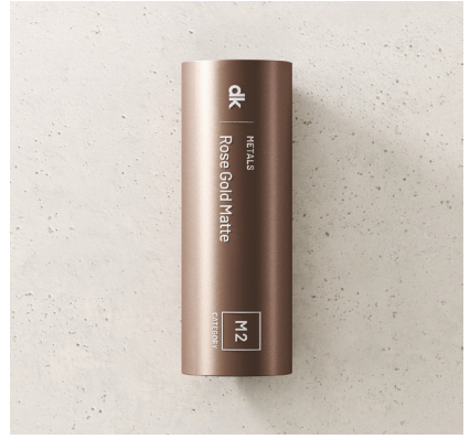
ROSE GOLD MATE