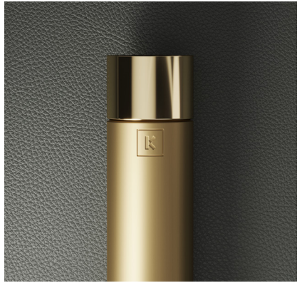
INOX DOURADO ESCOVADO