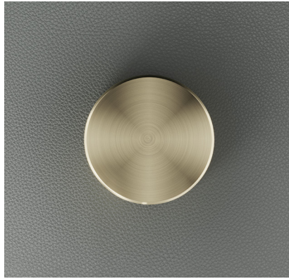
INOX DOURADO ESPIRAL