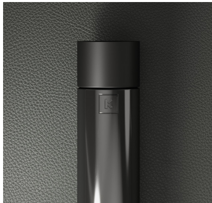
INOX POLIDO NICKELADO