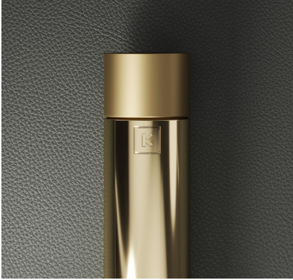
INOX DOURADO POLIDO