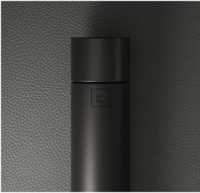
FERRO PRETO TEXTURADO