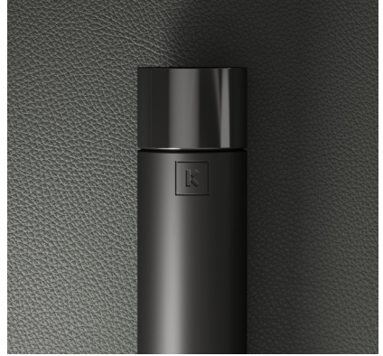
INOX NICKELADO MATE