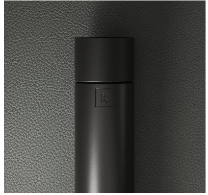
FERRO PRETO MATE