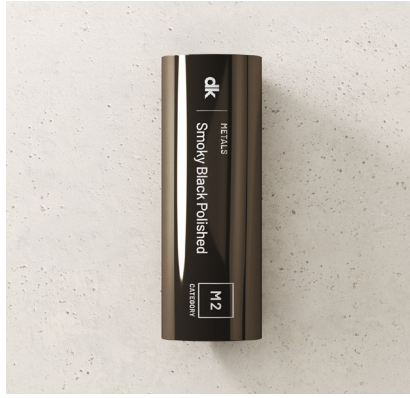
PRETO FUMADO POLIDO