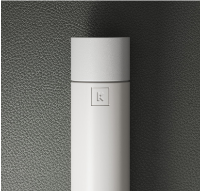
FERRO BRANCO MATE