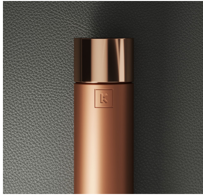
INOX COBREADO MATE