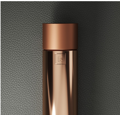
INOX POLIDO COBREADO