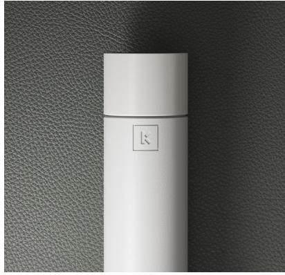
FERRO BRANCO TEXTURADO MATE